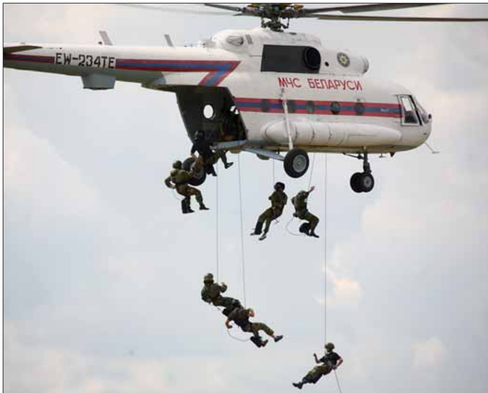
Ćwiczenia w desantowaniu z pokładu śmigłowca Ministerstwa do Spraw Nadzwyczajnych (MCzS)

dzie: 38., 317. i 350. samodzielnych mobilnych brygad. Siły mobilne, jako oddzielny rodzaj wojsk, weszły w skład Wojsk Lądowych. Tym samym brygady mobilne straciły na znaczeniu i stały się w teorii i w praktyce tylko nieco lepiej wyszkolonymi jednostkami ogólnowojskowymi działającymi na głównych kierunkach frontu. Jak żartowano w mobilnych brygadach: „Nasze zadanie proste, ale ważne – w dzień nie działać, ale w nocy utrzymać się/wytrwać”.