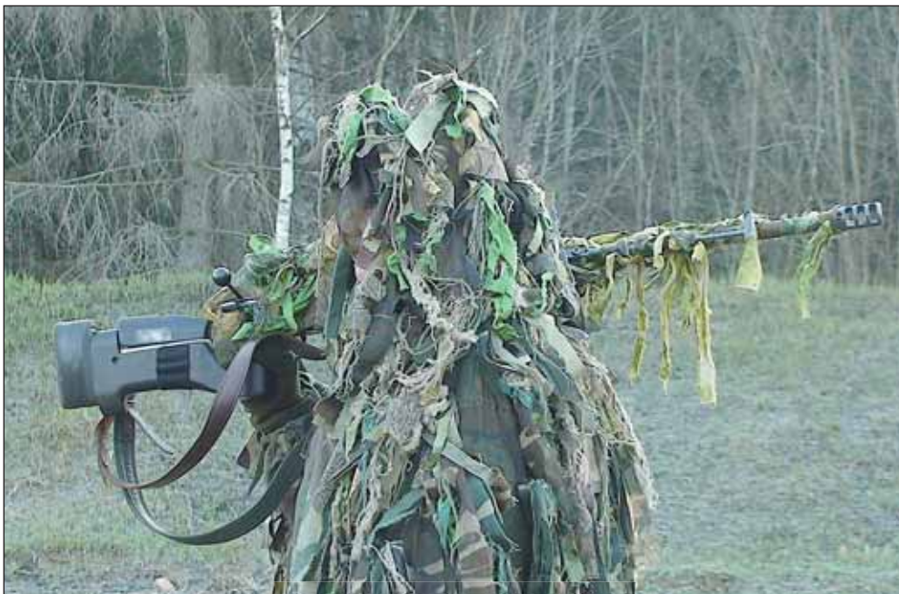
Strzelec wyborowy w maskalacie

W latach 1985-1988 walczył w Afganistanie 334. Samodzielny Oddział Specjalnego Przeznaczenia (Otdielnyj Otdriad Specnazu – OOSpNaz) sformowany na bazie brygady. Oficjalnie uznaje się, że 334. Oddział brał udział w 250 akcjach bojowych i zlikwidował ok. 3 tysięcy mullahów. W roku 1990 5. Brygada w niemal w pełnym składzie (805 specnazowców) wypełniała misję stabilizacyjną w Ormiańskiej SSR. 31