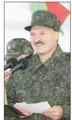
Prezydent Łukaszenka w białoruskiej „cyfrze”, ćwiczenia Zapad 2009 r.

Trzonem SSO są obecnie obie brygady mobilne, przygotowane zarówno do większych operacji z użyciem sprzętu ciężkiego, jak i do działań