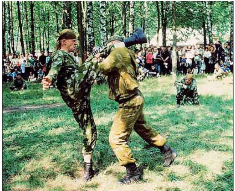
Pokazucha Specnazu w walce wręcz

Szczególnie dużą estymą i dumną tradycją sięgającą jeszcze II wojny światowej i wojny w Afganistanie może poszczycić się 5. Brygada Specjalnego Przeznaczenia. W historii sowieckiego specnazu uznaje się, że 5. Brygada Specnazu z Zachodniej Grupy Wojsk stacjonującej w Niemczech była jedną z najlepszych jednostek, która w okazałej liczbie ćwiczeń i manewrów uzyskiwała najwyższe noty i pochwały. W uznaniu zasług jednostki i wysokiego poziomu