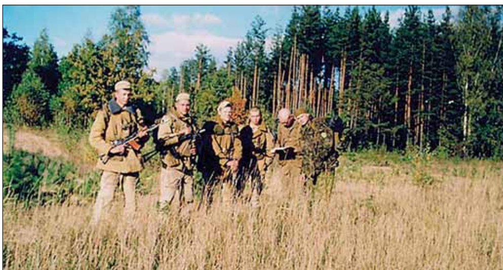
5. Brygada na ćwiczeniach

W sierpniu 1995 r. na bazie 103. Dywizji i 38. Brygady zostały sformowane siły mobilne w skła-