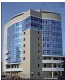
Departament KNB Astana

W każdym państwie instytucją, która może wykonywać takie zadanie, jest służba lub służby specjalne. Niewątpliwie służby specjalne Kazachstanu stoją na straży interesów nie tylko państwa, ale i długoletniego prezydenta tego kraju Nursułtana Nazarbajewa.